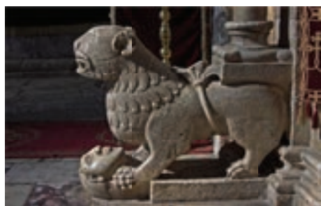
ПОРТАЛ НА УЛАЗУ У НАОС, ДЕЧАНИ, ДЕТАЉ, ЛАВ (1327–1335) PORTAL AT THE ENTRANCE TO THE NAOIS, MONASTERY OF DEČANI (1335), DETAIL

The rise of a new and powerful State in Macedonia was closely connected with the fate of Serbia in the tenth century. It began with the rebellion of Michael, a monk, a son of the Tsar Symeon of Bulgaria, against the existing rule over the Macedonian Slavs, who were under the government of Bulgaria proper. This rebellion failed because of the sudden death of the originator. When Tsar Peter died (969), the Macedonians succeeded in separating themselves from the Bulgarian rulers. In 972, John Zimiskes, the Byzantine Emperor, conquered the whole of Bulgaria and overran Serbia. In 973 the Macedonian rebels were quieted. In 976 they rose again, only now against the Greeks. The four sons of a Macedonian Count were the chief leaders. Before a year expired there was left only one of them – Samuel, whose ability made