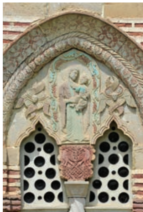
МАНАСТИР КАЛЕНИЋ, БИФОРА MONASTERY OF KALENIC, BIFORATE WINDOW