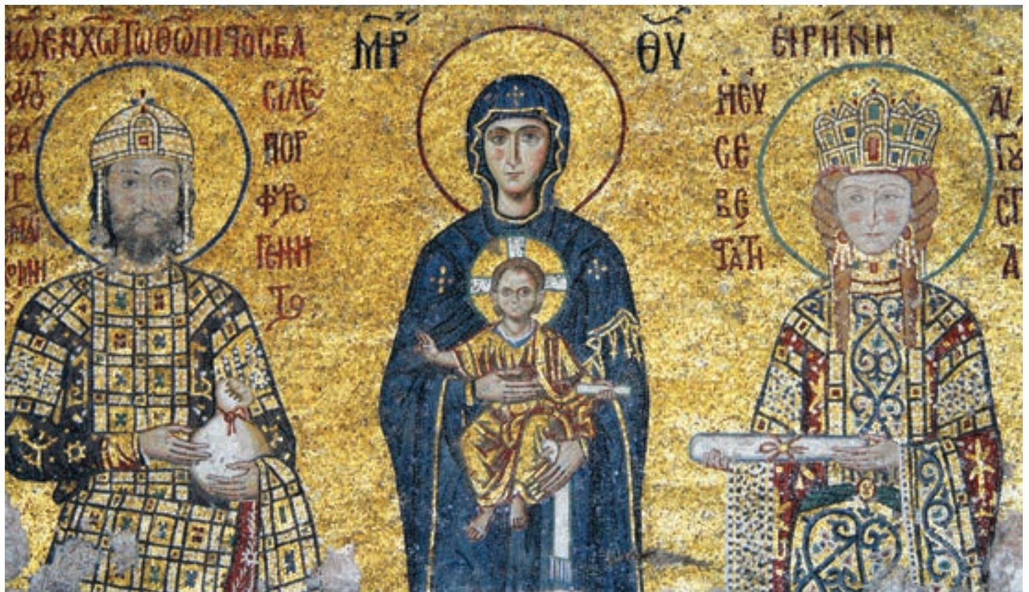
ЦАР ЈОВАН II КОМНИН, БОГОРОДИЦА СА ХРИСТОМ И ЦАРИЦА ИРИНА, ЦРКВА СВЕТЕ СОФИЈЕ, ЦАРИГРАД, ПОЧЕТАК XII ВЕКА EMPEROR JOHN II COMNENUS, MOTHER OF GOD WITH CHRIST AND EMPRESS IRENE, HAGIA SOPHIA, CONSTANTINOPLE, EARLY 12 TH CENT.

Nemanya ( Νεέμιαν ) was born at Ribnitsa (Dioclea) where his father had taken refuge on account of some tumults in Raška, with which he had been connected. After his father's return to Serbia, Nemanya, probably as early as 1159, held a part of Eastern Raška. When Tichomir was made Great Župan, Nemanya was given by the Emperor Manuel the districts of the rivers Toplitsa, Ibar, Rassina, and of Reke and Glubočitsa. This, perhaps, excited the jealousy of his brothers, who deprived him of his lands, and were soon punished for this action by Manuel. Tichomir was taken off to Constantinople, and Nemanya, on account of his ability or of the personal favour of the Emperor, became Great Župan (1169). He had on this occasion to give back Glubočitsa