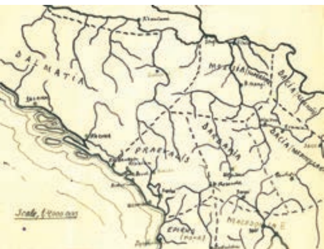
РИМСКЕ ТЕРИТОРИЈЕ КОЈЕ СУ ЗАУЗЕЛИ СРБИ ОКО 400. ГОДИНЕ, НАЦРТАО ЈЕЛИСИЈЕ АНДРИЋ (ПРЕМА СТ. СТАНОЈЕВИЋ, ИСТОРИЈА СРБА ) ROMAN TERRITORIES SETTLED BY THE SERBS C. AD 400, DRAWN BY YELISSIYE ANDRIC (RELYING ON ST. STANOJEVIĆ, ISTORIJA SRBA )