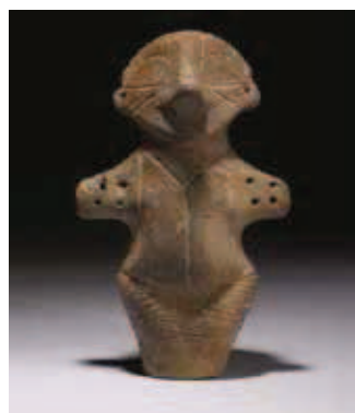
Vinča, udice od kosti i figura od terakote