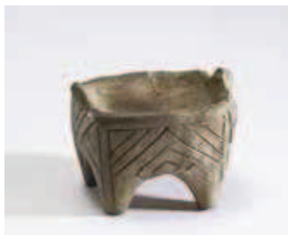
Vinčanska keramika, žrtvenik

kontinenta, a ovakvu ulogu je zadržalo i do današnjih dana. Zaista, drevni i moćni vodeni džin Dunav, dete nekadašnjih nestalih mora, opredelio je sudbinu velikog broja evropskih gradova, ali Beograda možda ponajviše.