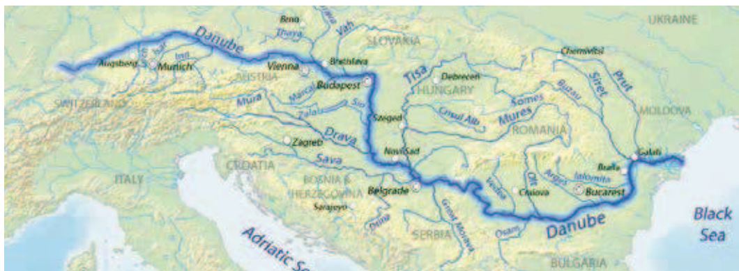
Tok reke Dunav

na lepom mestu razdvajanja voda. Ovaj lokalitet je već uveliko bio nastanjen i tada, a danas je prestonica moderne srpske države. Prolazak grupe besmrtnih junaka antičkog sveta ovim obalama neće biti usamljen slučaj, jer je istorija Beograda u vezi sa nebrojenim velikanima.